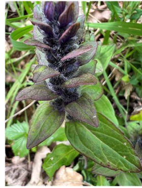
Ajuga reptans Bugle rampant