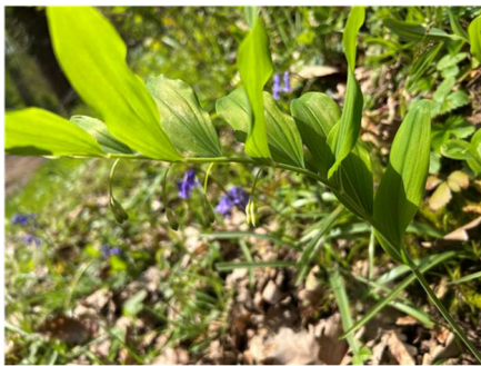
Polygonatum multiflorum Sceau de Salomon commun