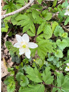
Anemone nemorosa Anémone des bois