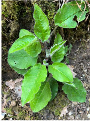
Hieracium morurorum Epervière des murs