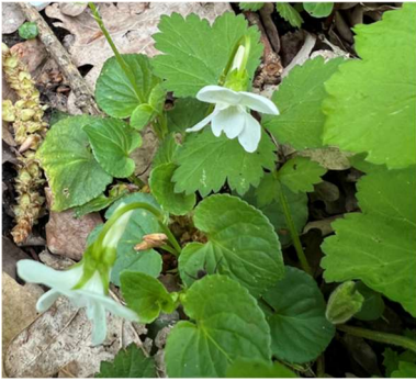
Viola – variété blanche