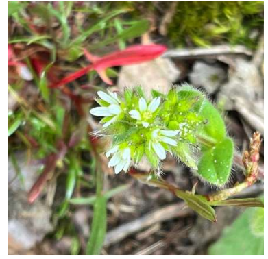
Cerastium glomeratum Céraiste aggloméré Avec en arrière plan une feuille rouge de rumex acetosella