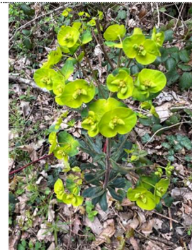
Euphorbia amygdaloides Euphorbe des bois