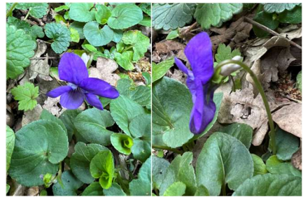
Viola riviniana Violette de rivin