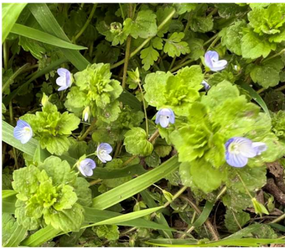
Veronica persica Véronique commune

Tout le long du chemin, de nombreuses plantes ont attiré notre attention :