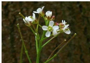
Cardamine flexuosa Cardamine flexueuse