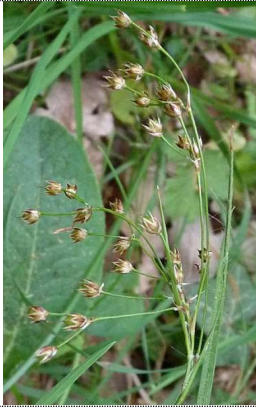
Luzule de Forster