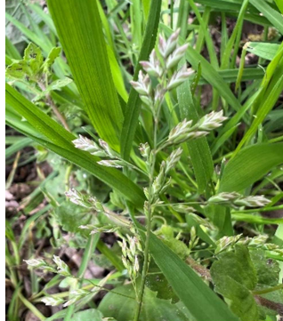
Poa annua Paturin annuel